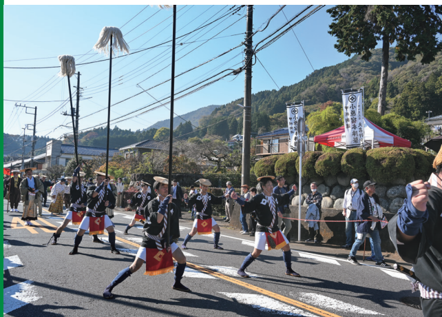
関東の登山の定番高尾山。秋には一面が紅葉で彩られる。