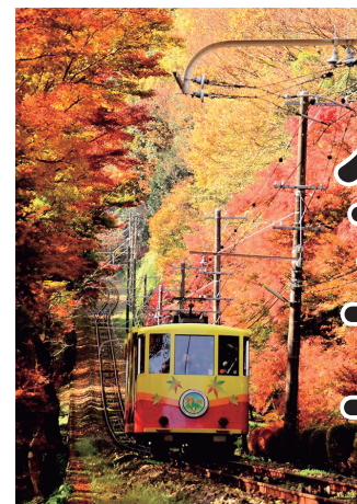
「秋の高尾山」© Hachioji City (licensed underCC BY 4.0)