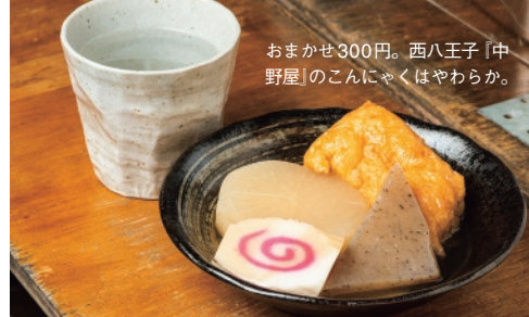
おまかせ300円。西八王子「中野屋」のこんにゃくはやわらか。