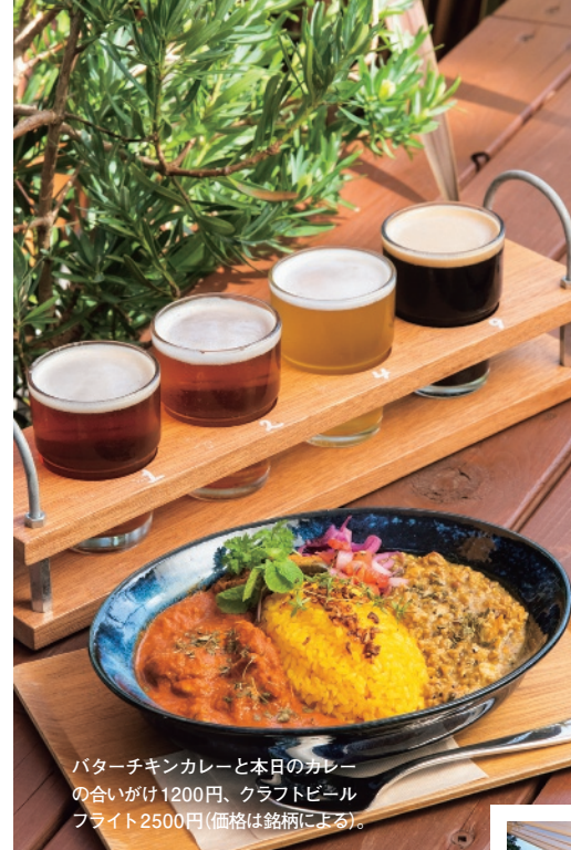
バターチキンカレーと本日のカレーの合いがけ1200円、クラフトビールフライト2500円(価格は銘柄による)。