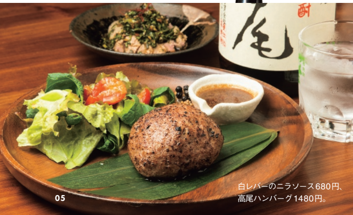
白レバーのニラソース680円、 高尾ハンバーグ1480円。

DATA JR・京王線高尾駅北口から徒歩5分。17～23時（フード22時LO）、日休。八王子市高尾町1548-6 ☎042・641・2681