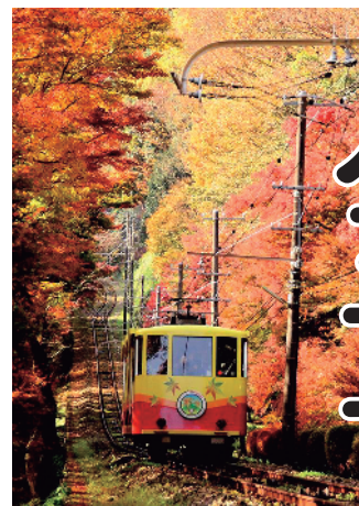
「秋の高尾山」