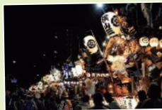
「八王子まつり」

19台の山車が巡行、獅子舞や関東太鼓大合戦を堪能できる。8月第1金から3日間 八王子市 甲州街道・西放射線ユーロードとその周辺 042・686・0611 (八王子まつり実行委員会)