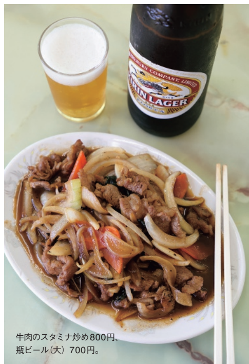
牛肉のスタミナ炒め800円、 瓶ビール(大)700円。

DATA JR・京王線橋本駅北口から徒歩10分。11時～13時30分LO・17時～19時30分LO（火は昼のみ）、月休（臨時休あり）。相模原市緑区東橋本2-19-4 ☎042・772・4717