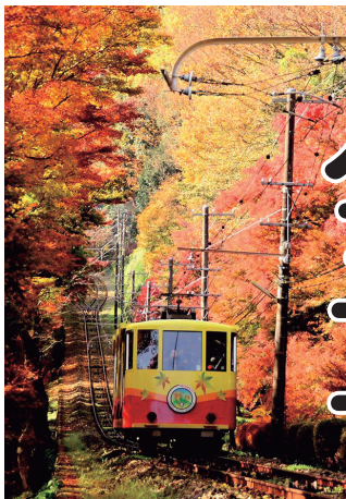
「秋の高尾山」