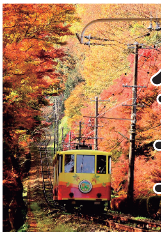
「秋の高尾山」