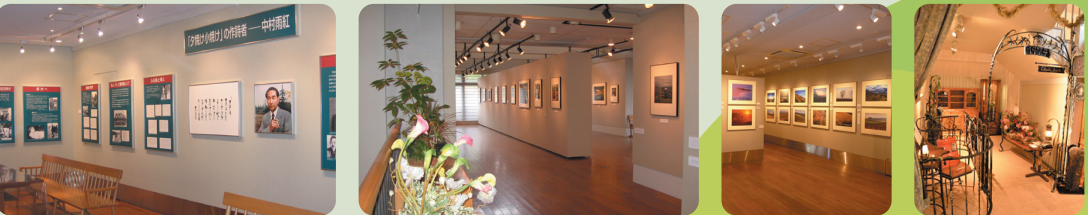
中村雨紅展示ホール 前田真三ギャラリー 市民ギャラリー チャーリー磯崎のロードアインミュージアム

八王子市の恩方地域出身、また、地域にゆかりのある方々の資料や作品を展示しています。